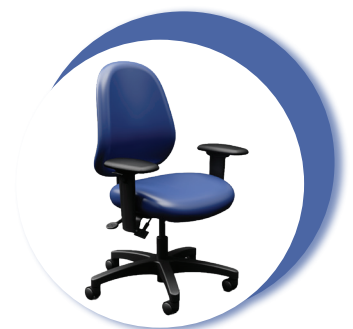
Chaise de travail dédiée nurseCentric

Le tissu Frixion Healthcare est disponible sur les sièges de tous les produits de la gamme healthCentric.