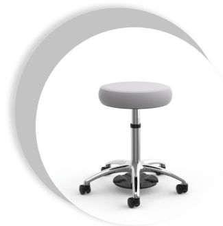
Tabouret médical ultime healthCentric

La couleur réelle du tissu peut varier par rapport aux couleurs et aux images affichées sur votre écran. Veuillez contacter votre représentant local pour commander des échantillons.